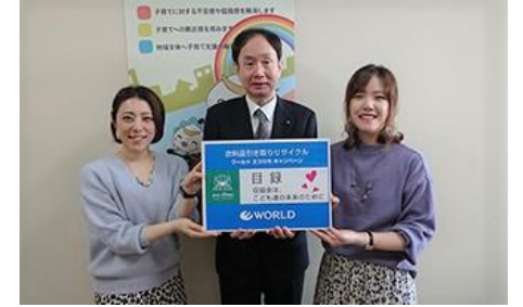
2019年11月19日(火) 宮城県保健福祉部次長 武内 浩行様(写真中央)に目録を贈呈するワールドストアパートナーズ社員

「東日本大震災みやぎ子ども育英募金」の寄附金を基金として積立て、被災した子どもたちの安定した生活と希望する進路選択の実現を支援するための奨学金・支援金として活用している。